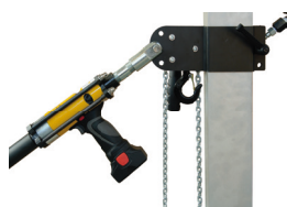
TOOL DI COLLEGAMENTO PER ELECTRO POWER CONNECTION FOR ELECTRO POWER