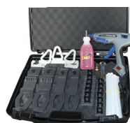
KIT ELECTRO PAD GLUE SYSTEM