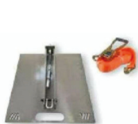
PIASTRA DI CONTRASTO CON VUOTO PNEUMATICO COUNTERSHOT BASE