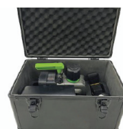
POMPA ELETTRICA PER CREARE IL VUOTO ELECTRIC PUMP TO CREATE VACUUM